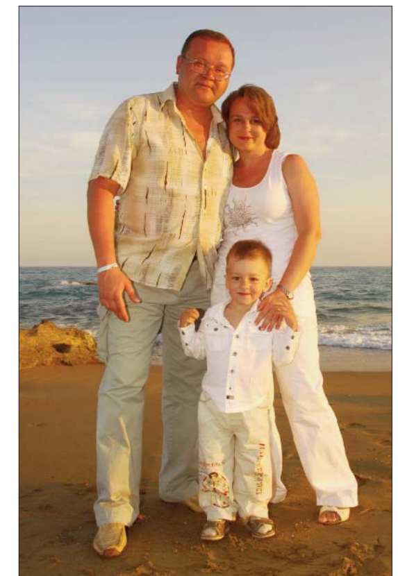
С мужем и сыном.